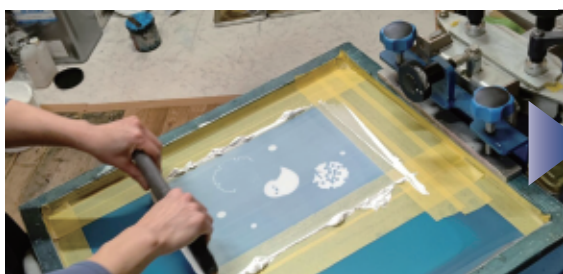
▲シルクスクリーン

生地以外にも木材、プラスチック、ガラス、金属など プリント箇所が平なものであればプリントすることができます！